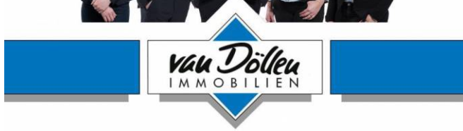
Van Döllen Team